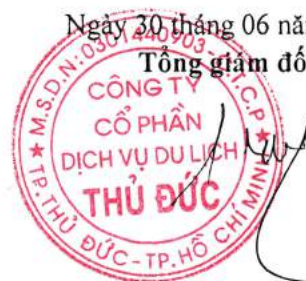
Đào Đức Cang